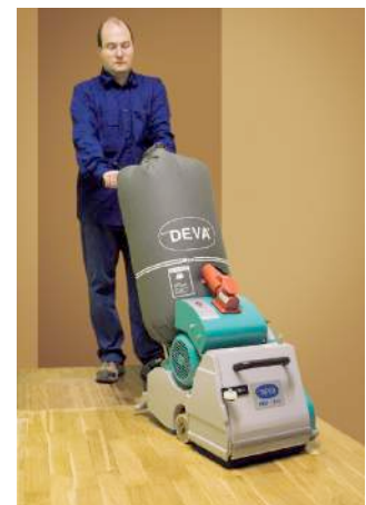
Proceso de Lijado y barnizado

Dependiendo del cuidado y trato que demos a un suelo de madera, un lijado y barnizado puede durar más de 25 años en perfectas condiciones estéticas, en éste proceso se pierde menos de 0,5 mm de madera por lo que tendremos un pavimento para muchísimos años.