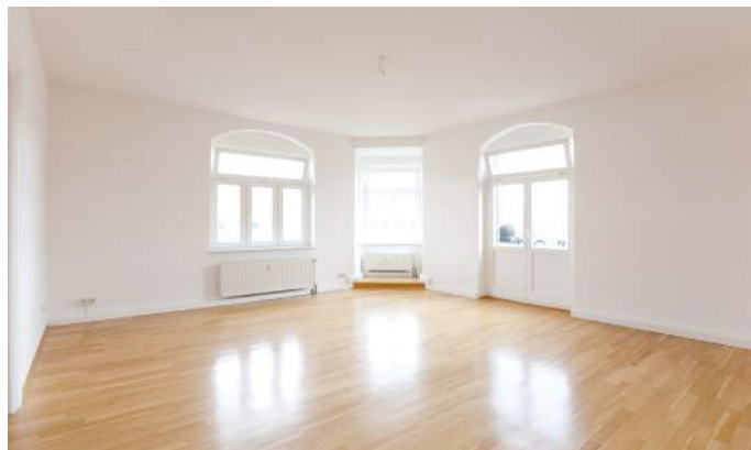
Parquet con madera de Roble

¿Le gustan las maderas oscuras ó rojizas como la Jacoba, Elondo, Teca, Caoba, etc? Estas especies generalmente hacen que una vivienda parezca más amplia, majestuosa y refinada.