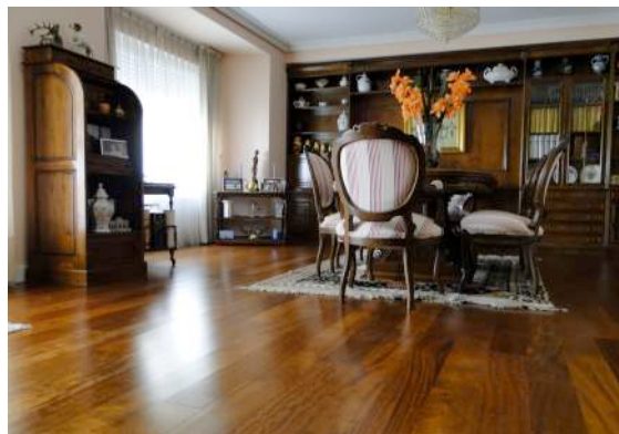
Parquet acabado en fábrica

Sin embargo, debido a que su parquet será lijado y acabado en su casa, usted debe esperar fuera de la vivienda durante la ejecución de los trabajos. En los últimos años, las máquinas lijadoras y los sistemas de contención de polvo se han desarrollado para ayudar a controlar el polvo y el ruido. Usted también tendrá que dar un tiempo de al menos 24 horas para que el acabado seque, tiempo durante el cual usted no podrá pisar el suelo.