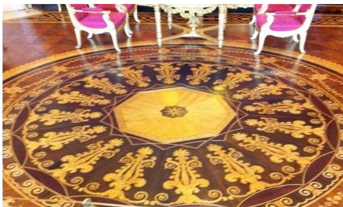
Palacio en San Petersburgo (Rusia) – 250 años de Parquet

Los pisos de madera son una de las pocas opciones de pavimentos que se hacen más bellos con el tiempo. Como todas las cosas naturales que experimentan cambios en el tiempo, los pisos de madera experimentarán cambios sutiles de color a medida que envejecen. Este es un proceso natural llamado pátina que añadirá aún más belleza a sus suelos.