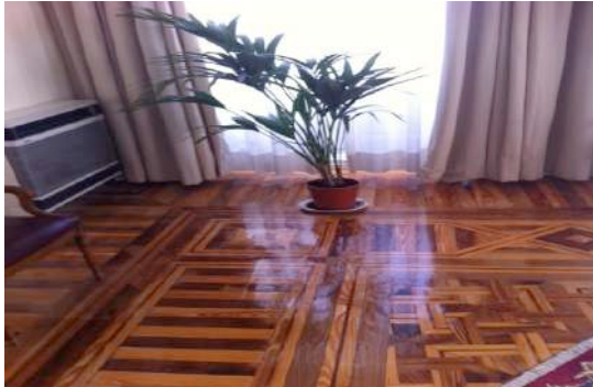
Parquet tradicional macizo